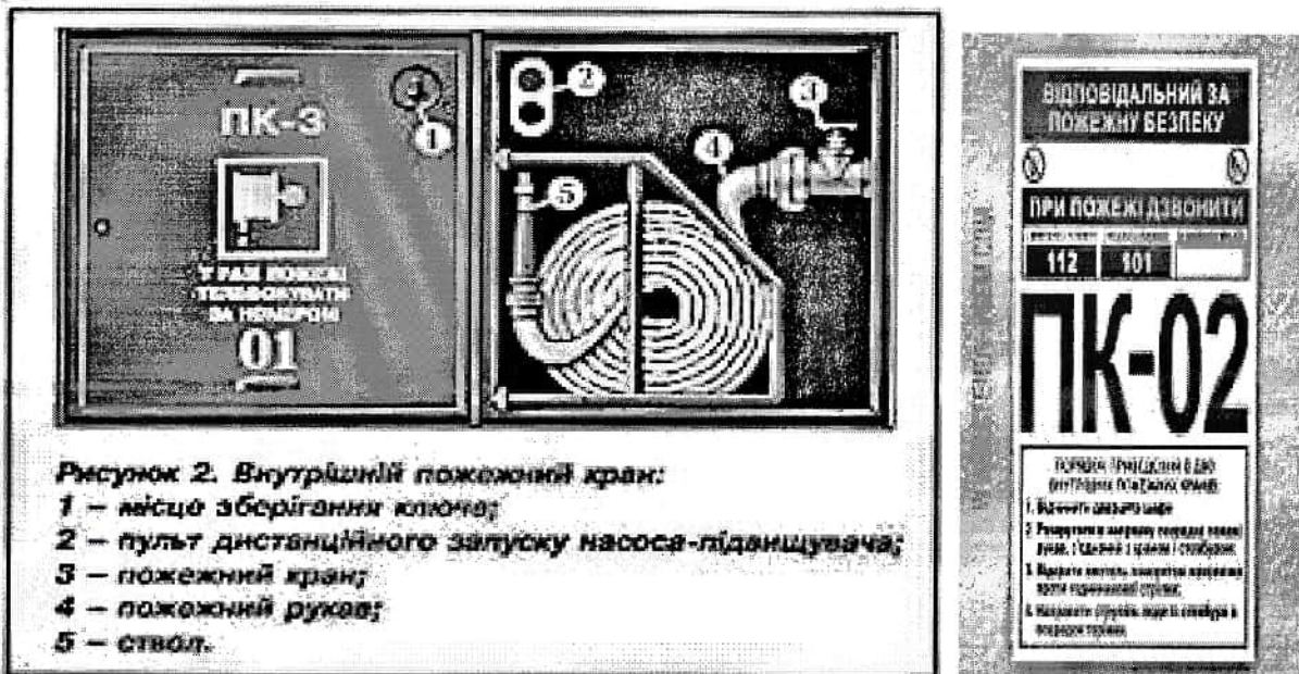
Рисунок 2. Внутрішній пожежний кран:

5.2. Пожежні кран-комплекти повинні розміщуватися у вбудованих або навісних шафках, які мають отвори для провітрювання і пристосовані для опломбування та візуального огляду їх без розкривання. При виготовленні шаф рекомендується передбачати в них місце для зберігання двох вогнегасників.